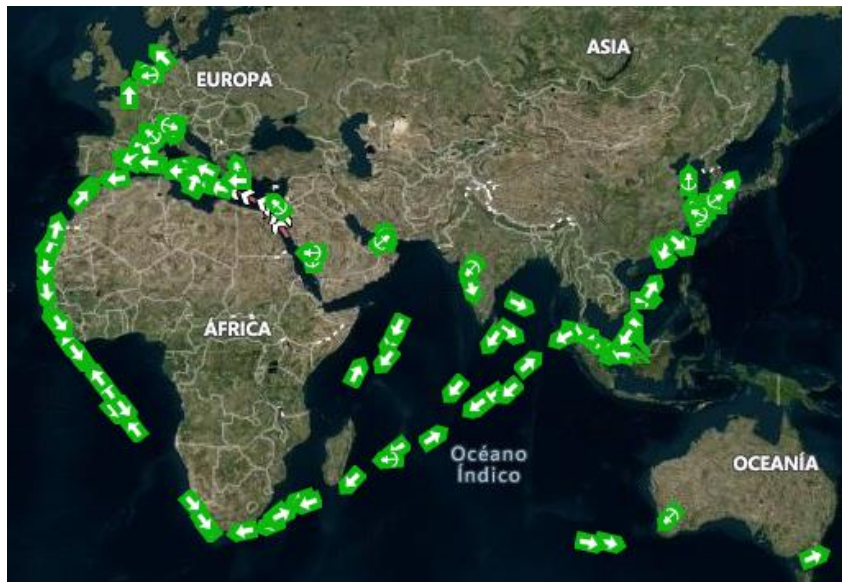
Figura 1: Posición de los buques asignados a los servicios con escala en el Puerto de Valencia y tránsito por el Canal de Suez (a fecha del 8 de febrero)